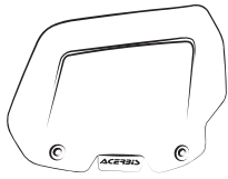
A - (2 PCS)